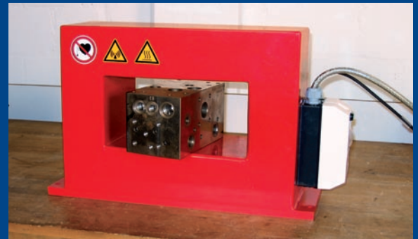
Die Spulen entmagnetisieren selbst bei sehr hohem Füllgrad zuverlässig.