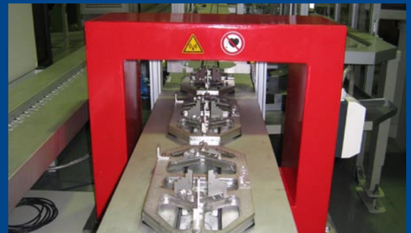
Pulsauslösung durch optionale Lichtschranke in einem automatisierten Produktionsablauf.