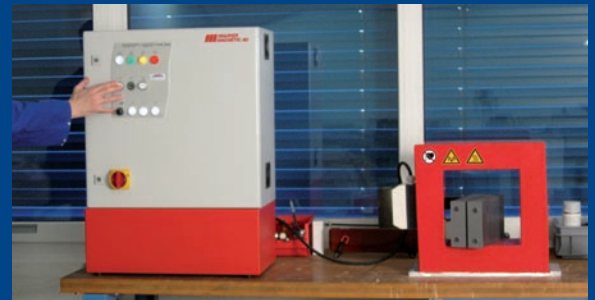
Die Bedienung erfolgt in sicherem Abstand zur Spule um eine unzulässige Feldexposition zu vermeiden.